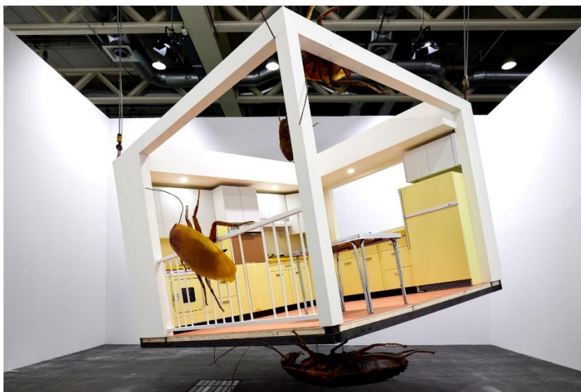
Huang Yongping: American Kitchen and Chinese Corckroaches. (2019). A hidegháború időszakában az amerikai álmot szimbolizáló amerikai konyha dől meg a művész installációjában. Forrás: artsy.net