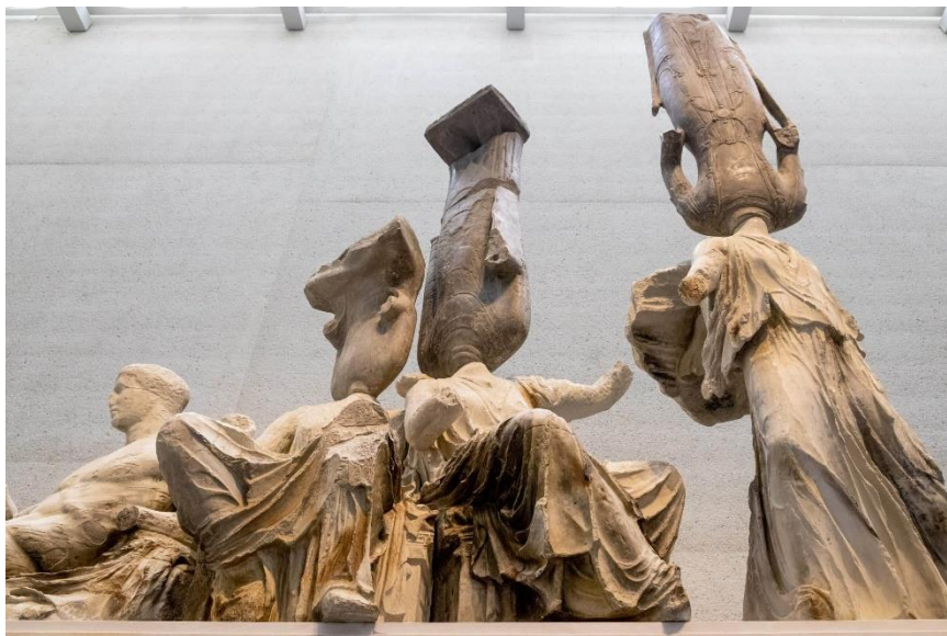
Xu Zhen: Eternity vs Evolution című kiállítás, részlet (2020).

A könyv Európában és Amerikában elképzelhetetlen szabotossággal mutatja be a fejlettség és a kíméletlenség közötti összefüggést. Nyugati szerző nem merne ilyen őszintén rávilágítani arra, hogy a nagyobb civilizációs különbségből logikusan következik az erősebb elnyomás. Persze valószínű Kínában is a Földön kívüli civilizációk és az interplanetáris tér elemzése lehet ennyire lényegre törő.