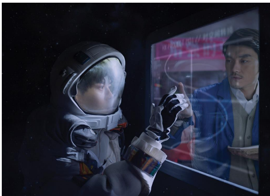
Cao Fei: Nova, részlet (2019).

Minél távolabbról jön és minél tágabbra nyitja a történetet a sci-fi író, annál jobb. Így kínálja magát egy sűrű munkás év után Cixin Liu Háromtest-trilógiája.