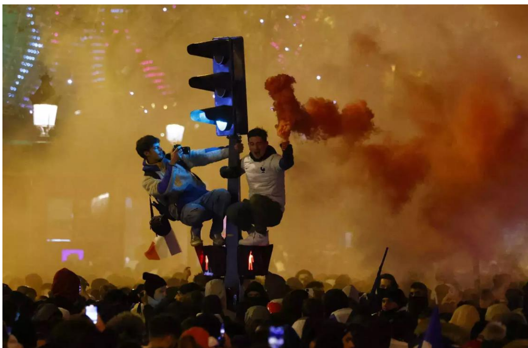
A 2022-es világbajnokság döntője utáni zavargások Párizsban

Elég sok jel utal arra, hogy a világot látjuk másképp . Háborúk, válságok, természeti csapások mindig voltak, csak jobban elfogadtuk vagy kevésbé vettük észre őket. Az ideológiai változások, a világ összekapcsoltabbá válása és a tájékozódást, tájékoztatást átformáló digitális technológiák formálták át azt, ahogy a világra nézünk.