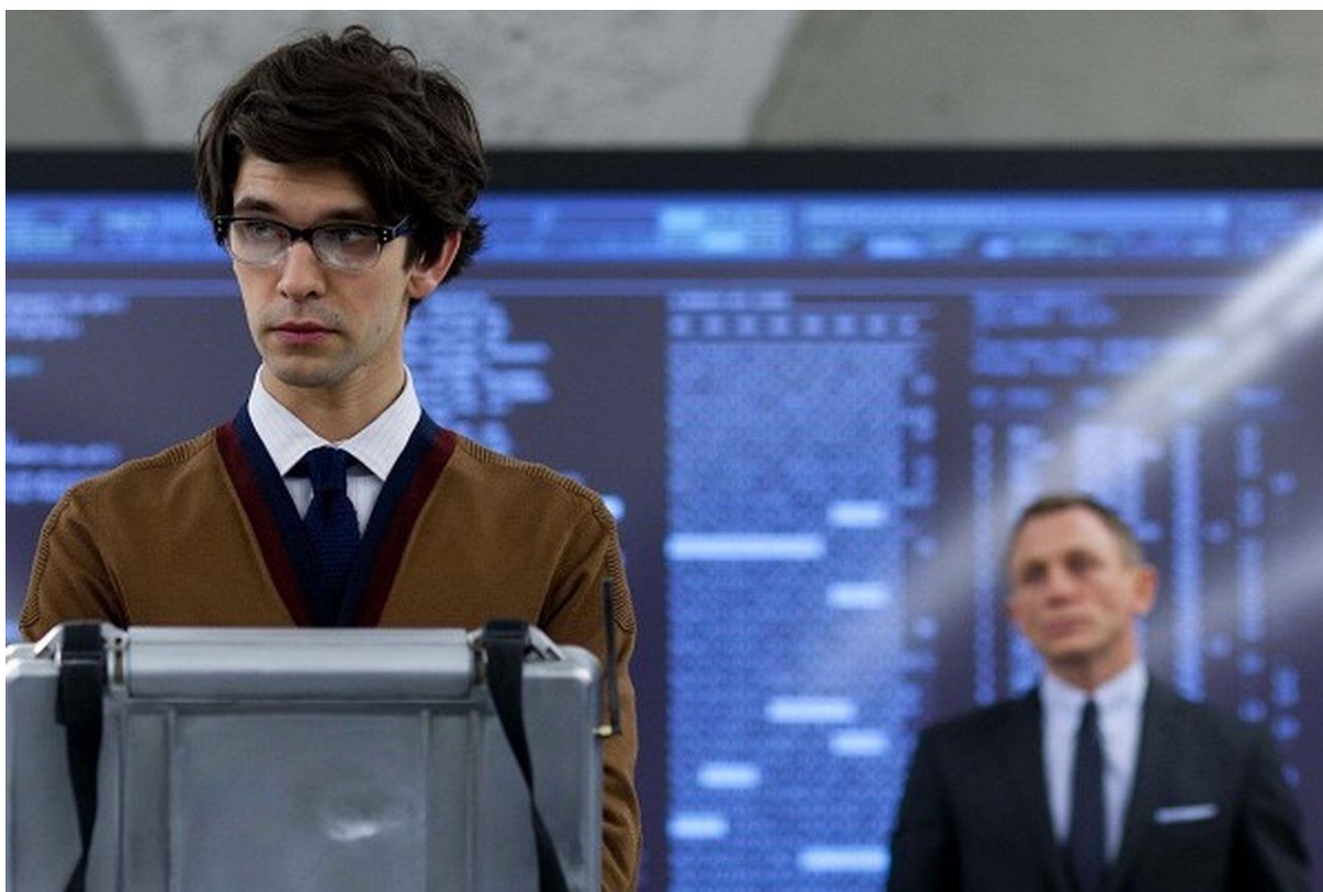
Az öreg James Bond és a fiatal Q találkozása – Skyfall