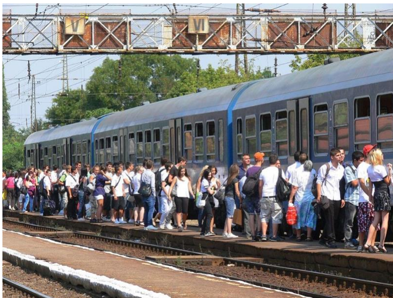
Tömeg a Rákospalota-Újpest állomáson.

Az előzetes adatok szerint az utóbbi évtizedben felgyorsult a népességfogyás 1980-as években elindult, a korábbi cikkünkben elemzett trendje . 2001 és 11 között bő negyedmillióval, a tízes években 330 ezerrel lettünk kevesebben.