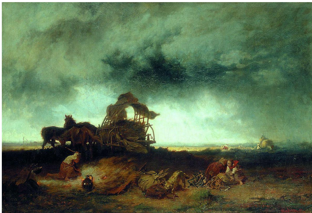
Munkácsy Mihály: Vihar a pusztán

Szomorú korszakok szomorú verseit: Ady Endre 1909-ben írt Kocsiút az éjszakában , Babits Mihály 1925-ben megjelent A gazda bekeríti házát című költeményét idézi fel a táblázat.