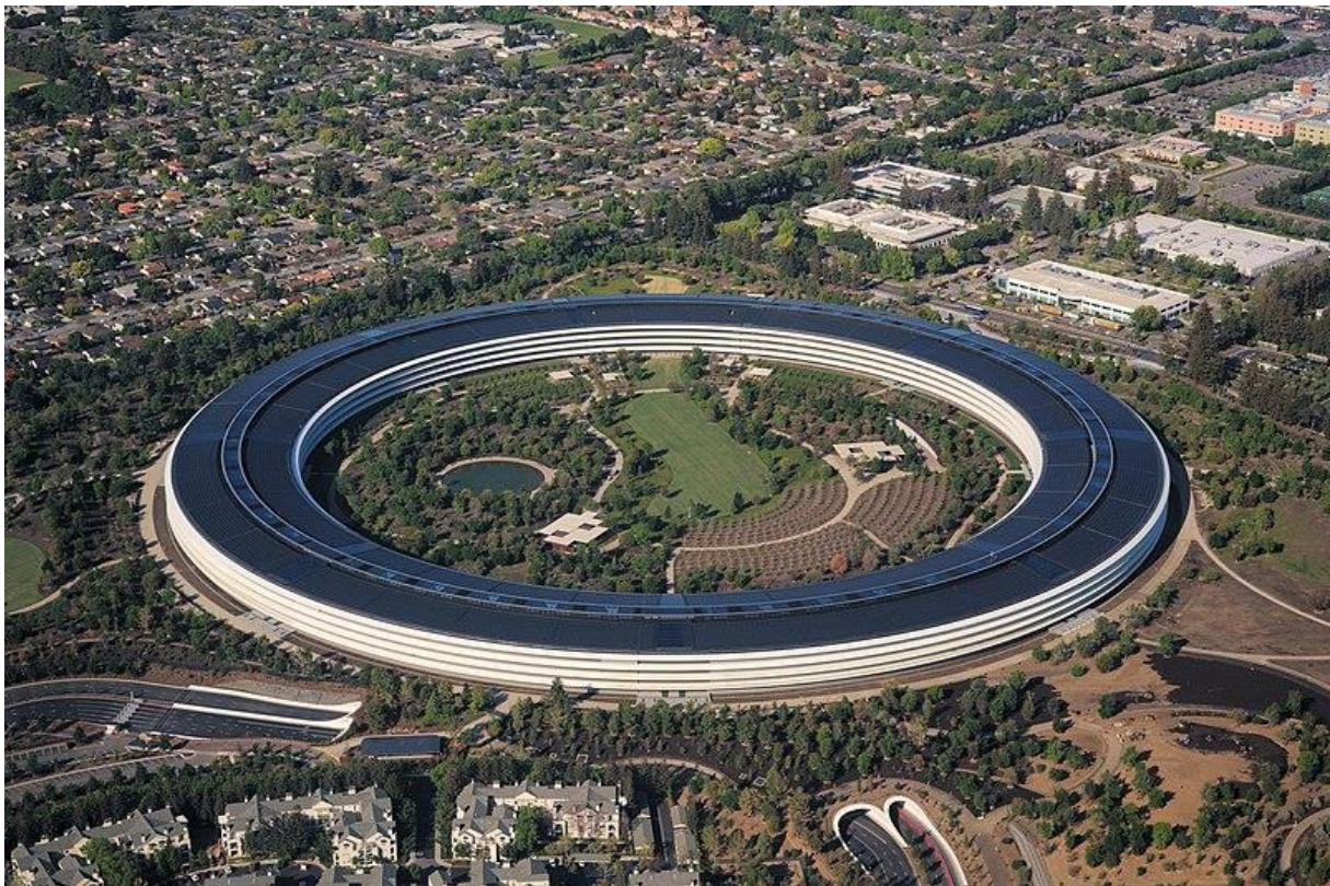
Az Apple központja

A számítógép révén az információ vált a gépek produktumává. Egyre kevésbé kell ember az adatok, a tudás gyűjtéséhez, feldolgozásához, közvetítéséhez. Lényegében ugyanaz folyik tovább, mint ami az ipari forradalommal elindult: még sűrűbb és intenzívebb hálózati lét, még jelentéktelenebbek a földrajzi távolságok, még erősebben, még inkább világszinten koncentráldódik a gazdasági erő, még jelentősebbek a vagyoni különbségek. Ezért cserébe még inkább az emberi igényekhez illeszkednek a termékek, még kényelmesebb az élet.