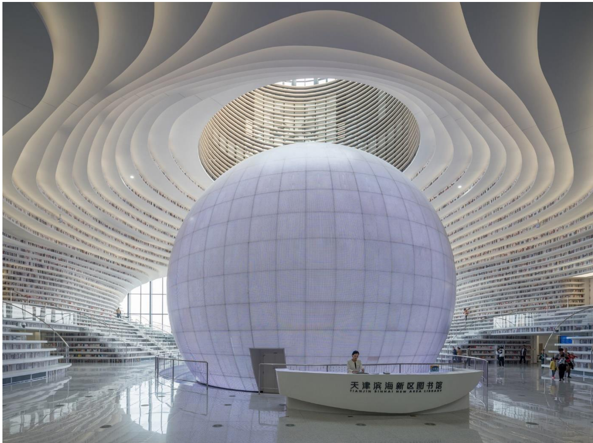
A Binhai könyvtár Tiencsinben

A nyugati világból nézve ez hihetetlenül tűnhet, de keleten és délen nagyrészt ez történik. A nyugati politikában is egyre jelentősebb ez a megközelítés, akár eltörölni, akár megerősíteni akarja az emberi identitás jelentőségét. A gazdaságpolitikában is veszít pozíciójából az az álláspont, hogy az állam dolga a piac zökkenőmentes biztosításának működése. A járványvédelemhez hasonló közfunkciók erősítésének szándéka, a klímasemlegesség célja, a nemzetbiztonsági szempontok megerősödése mind azt jelzi, hogy megdőlhet a globális piac mindenhatósága. Ha ez így lesz, nem a tőzsde és az ott beruházókat összefogó alapok, nem a multik szofisztikált célmutatórendszereket kidolgozó központjai, nem a globális tanácsadó cégek és a globális gazdaságot támogató világszervezetek lesznek a világ sorsát eldöntő intézmények, nem ide igyekeznek mindenki, aki anyagi sikerre vagy nagyra vágyik.