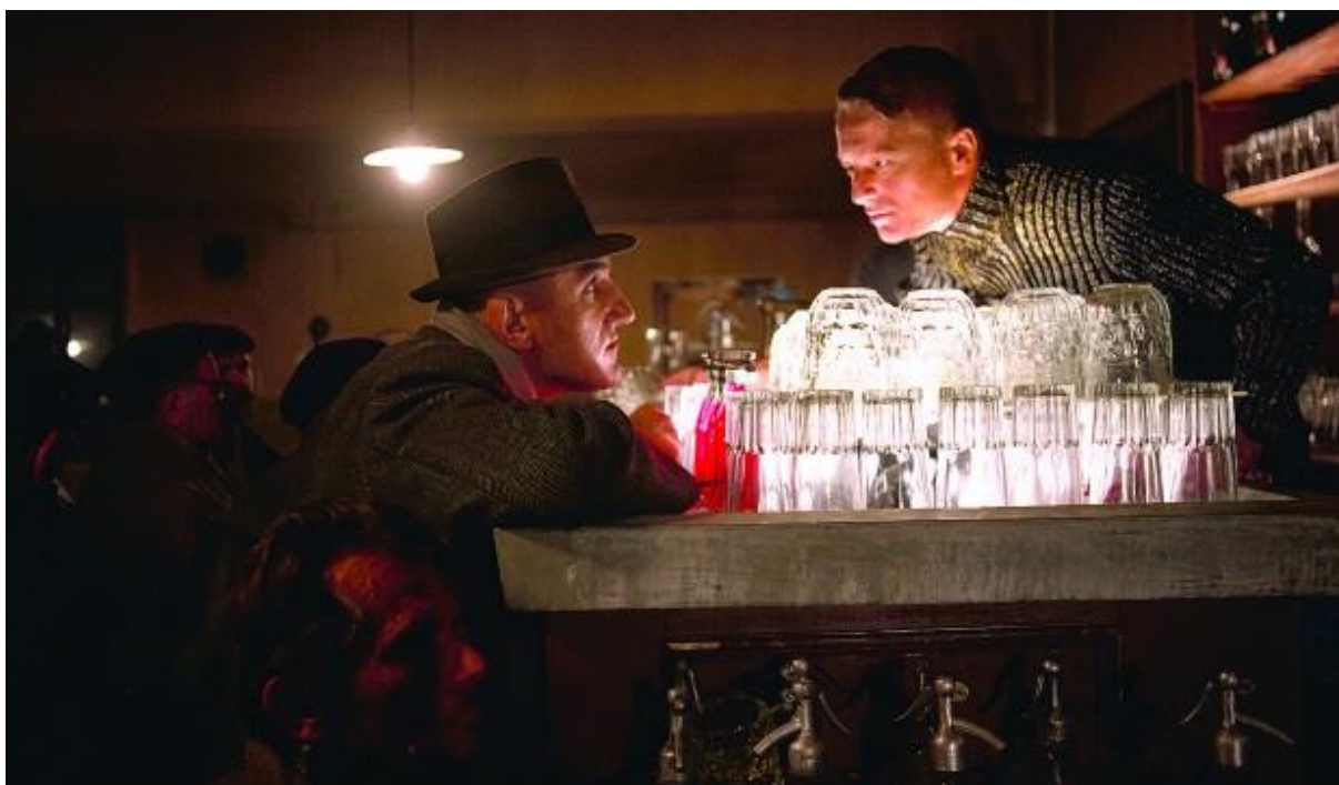
A Teleki Tér régi és új császára az Eldorádó című filmben

Amikor mi, mai szülők, gyerekek voltunk, még nem volt internet, még voltak határőrbódék. A Pannónia filmstúdióban szinkronizált Bud Spencer filmek és a hangalámondásos nindzsás videók jelentették a globális kultúrát, a nyugati zenét és a számítógépes játékokat kazettán másoltuk. A kommunizusból való kiszabadulás azért okozott sokkot rendszeren – a dolgozó élet elkezdésében az új szabad káoszt nem értő szülők gyakran már nem tudtak segíteni, nem is értették, lányuk fiuk mit is csinál pontosan. A világ azért elsősorban Hegyeshalomtól Záhonyig tartott, ezen kívül volt az egzotikus, veszélyes és csillogó külföld. A város sok „egyetlen forradalmára” az utcán, a kocsmákban, az iskola folyosóján szőtte a szociális hálóját. Ez a kor azonban már majdnem olyan messze van a mostani fiataloknak, mint a Pál utcai fiúk világa.