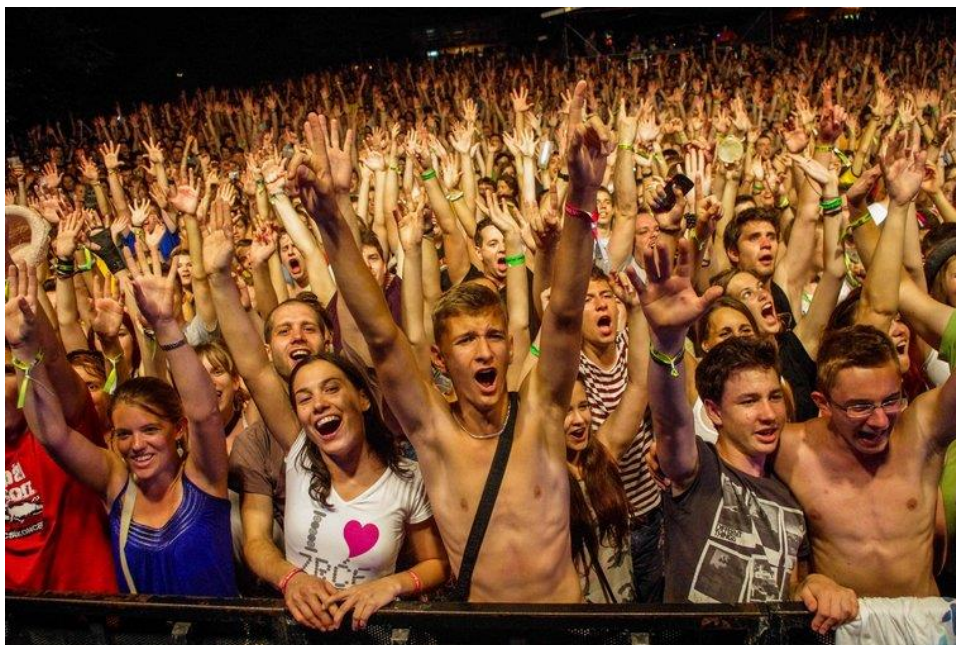
Fishing on Orfű

Az ember ahogy nő, folyamatosan tágul körülötte a világ. Először csak anya van, majd apa is. Aztán jön a tágabb család, az ismerősök, a játékok. Idővel megjelennek a képernyők, a kortársak, a nevelők. Az olvasni tudással, a tájékozódási képesség és szabadság erősödésével egyre erősebb és gazdagabb lesz a tartalomipar szerepe: számítógépes játékok, videók, platformok, könyvek, filmek, zenék. Kitágul a tér is, egyre több helyre és egyre inkább egyedül jut el a gyerek. Aztán felnő, övé a világ, ő pedig a világé.