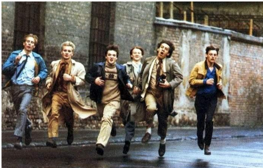
Fotó a Megáll az idő című filmből

A család és az utca dominanciáját töri meg a hadsereg és az ipar igényei szerint kiépülő közoktatási rendszer. Az iparosodást kísérő szekularizációval háttérbe kerülnek az egyházak. A mozi, a rádió, a tévé, a számítógép, majd az internet megjelenésével megnőtt a tartalomipar szerepe. A kortársak jelentősége nem igazán változik, hol a grundért verekedve, hol a házibulik intimitásában, hol a fesztiválokon, hol a közösségi portálokon csetelve formálják magukat az egymás utáni korosztályok.