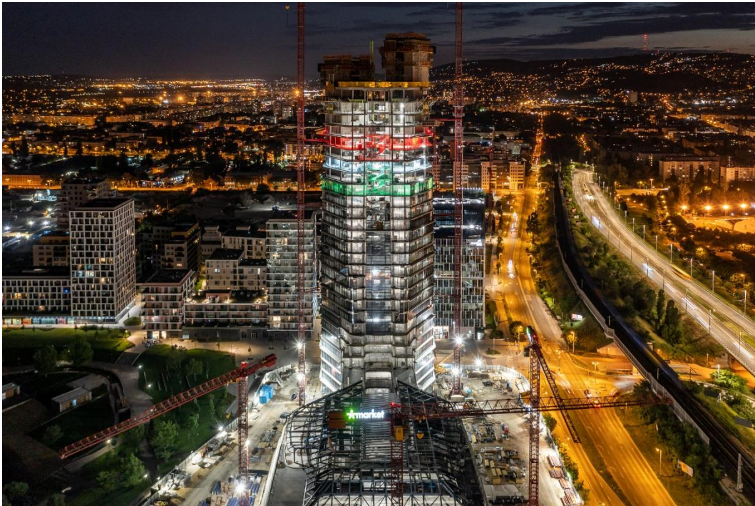
Az épülő MOL torony

A Trianon utáni Magyarország létrejötte óta a világ gyorsabban fejlődő országai között van, a leggazdagabb országokhoz az utóbbi 30 évben kezdtünk felzárkózni. Jelenleg – egy főre számítva - a 10 leggazdagabb (nem olajállamként működő) ország nemzeti össztermékének 45 százalékát állítja elő a magyar gazdaság – száz éve, az ötvenes évek elején és a rendszerváltáskor ez az érték egyaránt 32-33 százalék volt.