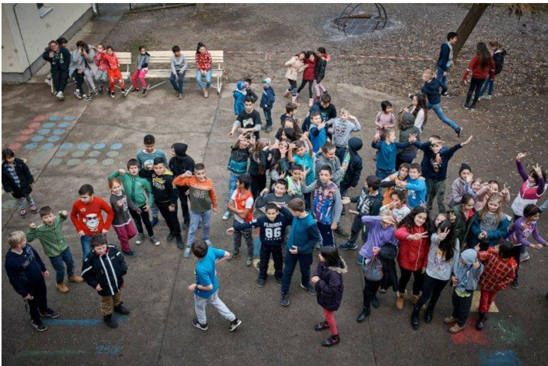
A hejőkeresztúri iskola

A gazdaság növekvő emberigénye megteremtheti ezt a fordulatot. A humán erőforrások fejlesztésének várható hozama olyan mértékben megnőhet, hogy érdemes rá komoly forrásokat szánni, vállalni az intézményrendszer átalakításával járó konfliktusokat. Megszülehetnek a koncepciók, amelyek nem kizárólag a hivatásrendi (orvosi, tanári) szempontok és a felső-középosztály igények alapján foglalkoznak a témával, hanem a szektorok átalakításának humán tőkében kifejezhető hozama felől közelítenek. Kialakítható az alku, amelyben a gazdaság, a szolgáltatásszervező szakmák és a rendszer korábbi relatív nyertesei megtalálják a maguk helyét, amely a kormányzat számára elfogadható kockázat mellett, politikailag értelmezhető hozamot ígér a szektorok átalakításáért és feltőkésítéséért. Erre építve egy évtized után együtt örülhetünk majd az emberek bővülő tudásából, javuló egészségéből származó gazdasági növekedésnek.