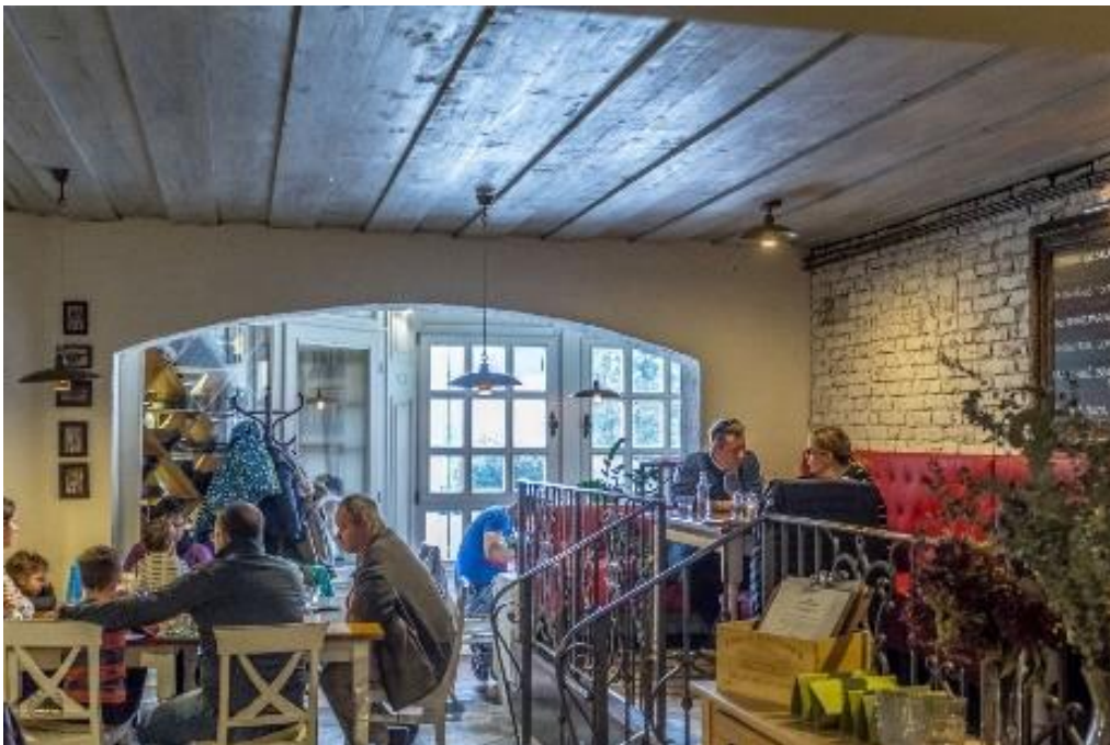
Az Anyukám mondta étterem Encsen

A minőségi ételek, az igényes szabadidő eltöltési lehetőségek csak a jéghegy csúcsát jelentik a fogyasztás minőségi forradalmában. Ez a folyamat megnyitja a piacot a hazai nagyobb hozzáadott értékű szolgáltatásokat kínáló vállalkozások számára, új termékek, szakmák megjelenését teszi lehetővé. Ezáltal a hazai gazdaság jelentős része léphet át az ár- és költségvezérelt, alkalmazkodó logikából, a minőség- és fogyasztó vezérelte, kezdeményező működésbe.