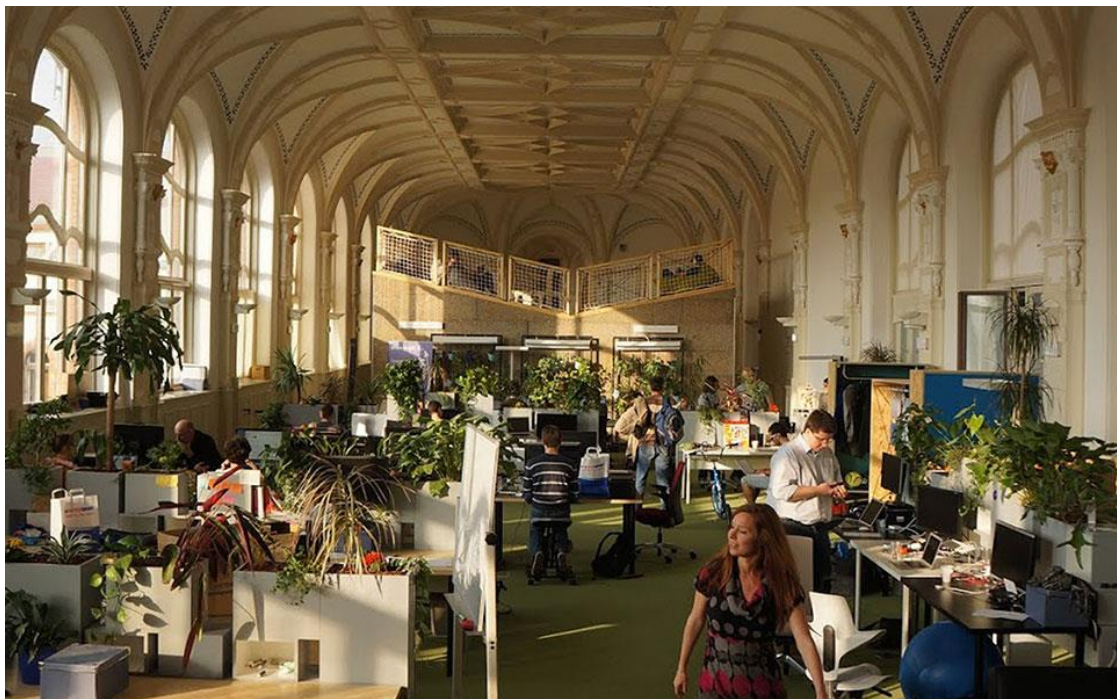
A Prezi irodája Budapesten

Az elmúlt harminc év másik nagy története a külföldi működőtőke globális rendszerébe való bekapcsolódás. A visegrádi térség a globalizáció harmadik korszakának fontos telephelyévé vált, a termelést világméretben optimalizáló termelési láncok tőkésje és tudása lett a gazdaság fejlődésének fő motorja. Az összeszerelő üzemek, az autógyárak, a szolgáltató központok és a beszállítói lettek a gazdaság kulcsszereplői. Már nincs olyan szeglete a magyar gazdaságnak, amelyik ne illeszkedne be a gyártás, a kereskedelem, a szolgáltatások és a finanszírozás globális láncába. A világ egyik legnyitottabb, leginkább alkalmazkodóképes gazdasága lett a miénk a sörgyárhoz hosszútávú szerződéssel kötődő falusi kocsmától a budapesti technológiai fejlesztő központokig.