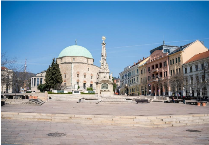
Pécs belvárosa a tavaszi karantén idején

Korábbi sorozatunkat a magyar városok főtereiről ide kattintva érheted el.