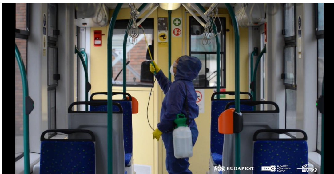
Fertőtlenítik a budapesti villamosokat

Ezekhez a trendekhez kell a vállalkozóknak igazodniuk: