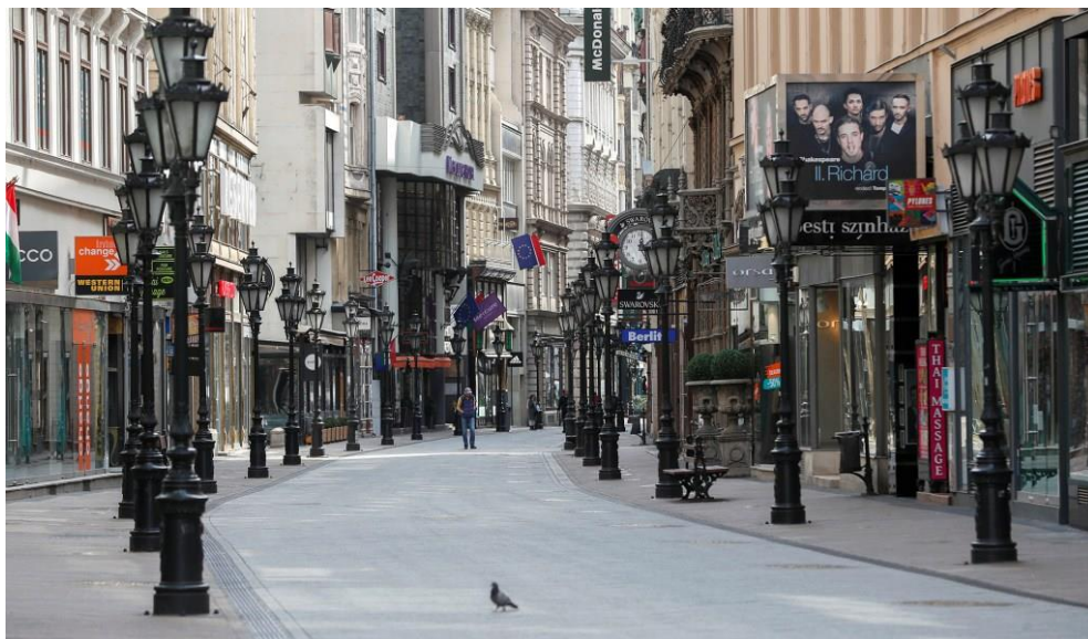
Az üres Váci utca 2020 márciusában

Hogyan lesz ez a koronavírus után? Egyelőre csak spekulálni tudunk. Nem tudjuk, meddig tart a járvány, lesz-e végleges és megnyugtató megoldás. Nem tudjuk, megint van száz évünk a következő hasonló vírusig vagy nincs. Az azonban valószínűnek tűnik, hogy be fogunk rendezkedni a hasonló járványok sikeres kezelésére, a virtuális világ előretör, az otthon, az egészség felértékelődik.