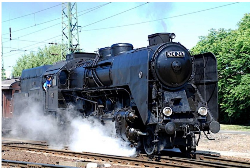
A 424-es – magyar tervezésű és gyártású gőzmozdony

Az elemzéshez használt adatbázist 2018-ban publikálták a Groningeni Egyetem kutatói. A Maddison Project adatbázisa a fellelhető történelmi dokumentumok, gazdaságtörténeti tanulmányok és közgazdasági elemzések alapján készült. Legújabb verziójában új módszertant használtak , ebben az országok közötti árkülönbségek pontosabb kiküszöbölésének köszönhetően az egyes országok jövedelmei jobban összehasonlíthatóak. (Az új adatbázis részletes módszertani bemutatása itt. ) A módszertani kérdésekre a cikk mellékletében térünk ki részletesebben.