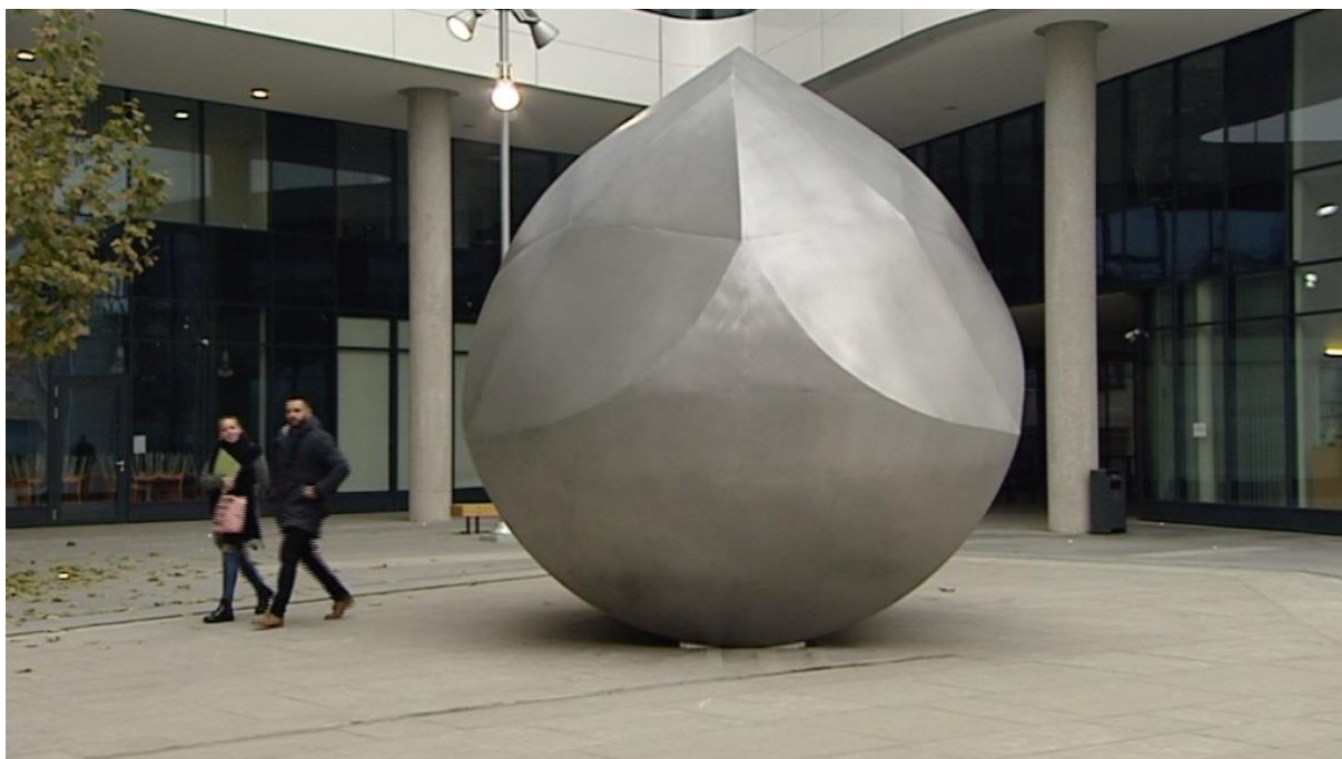
A Gömböc szobra a Corvin Sétányon

Siker, hogy száz év alatt gazdasági lemaradásunk felét ledolgoztuk Spanyolországhoz, Nagy-Britanniához vagy Franciaországhoz képest. Ebbe munka is van, nem csak az, hogy ők pechükre elveszítették a gyarmataikat, mi pedig nem.