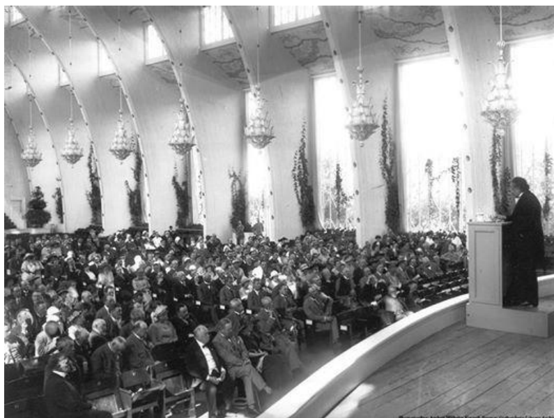
Albert Einstein Nobel díjas előadása 1923-ban

A tudós olyan ember, akit kollégáin kívül nem sokan értenek, munkájuk eredményei sokszor évtizedekkel később hatnak a mindennapi életre. Ki, hol és mire fogja használni a felfedezést? A világot mentik meg vele, vagy veszélyes fegyvert fejlesztenek a felfedezésből? Azt előre nem tudhatja senki. Komoly elkötelezettség kell ehhez, bízni kell a jövőben és az emberiség egészében vagy nagyon szeretni kell az embernek azt, amit csinál ahhoz, hogy egy életet töltsön el néhány nagy kérdéssel.