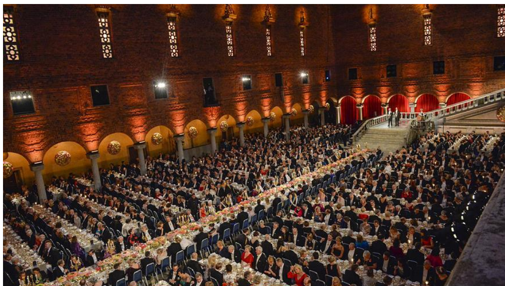
A Nobel díj gálavacsorája a stockholmi városházán

Jó ötlet és menedzsment – A Nobel díj a hatalmas indulóvagyonhoz képest szerénynek látszó célt tűzött ki. Az 1901-ben induló alapítvány feladata az lett, hogy évente öt díjazottat válasszon ki, jutalmazzon és ünnepeljen meg úgy, hogy az alapító vagyon értéke ne csökkenjen. Egy díjazott ma 270 millió forintnyi összeget kap – a jutalom értéke az induláskor is körülbelül ennyi volt. Világraszóló dicsőséget és gazdagságot ígér a díj öt embernek egy olyan közösségből, akiket nagyon tisztelnek, de kevésbé ismernek és értenek. Emellett a kifizetett jutalmaknál picit többet költenek a díjazottak kiválasztására és a díj eseményeire. Fókuszáltság, hosszú távú fenntarthatóság, alapos előkészítés és kommunikáció. Management by Nobel.