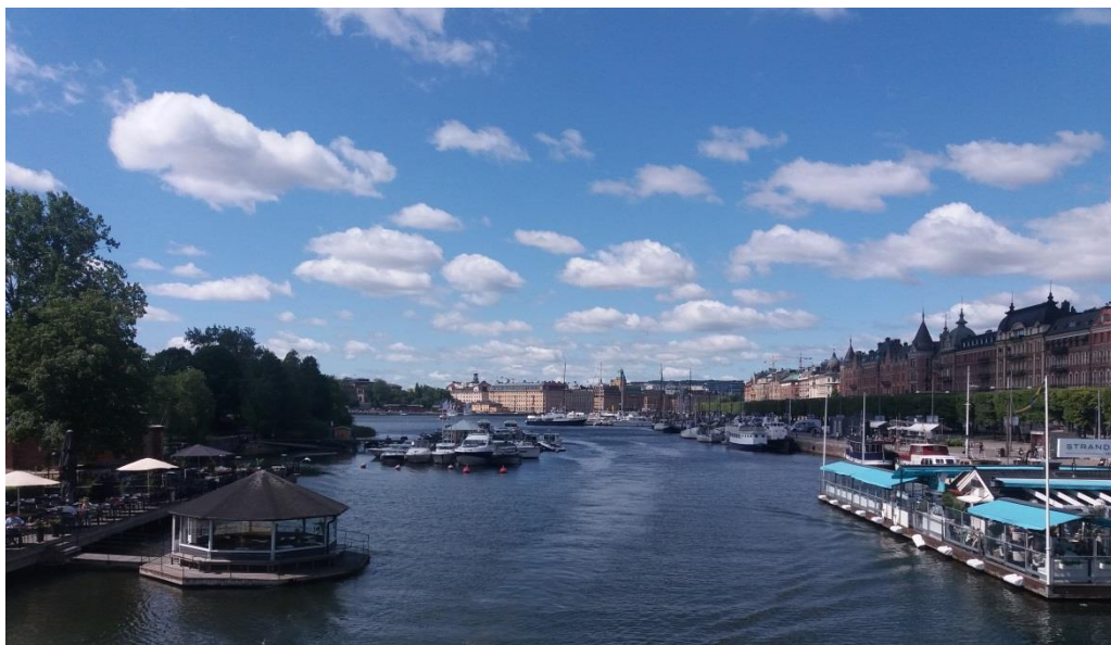
Stockholm, 2019. június

Mindez nem csak a múltbeli sikerek eredménye. Habár Nobel a XIX. század embere volt, a Volvot is megvették már a kínaiak, nincs vége az aranykornak. A 21. század sikeres cégei (pld. a Minecraftot készítő Mojang vagy a Spotify) arról árulkodnak, hogy ma is képesek tartani a tempót a világgal. A