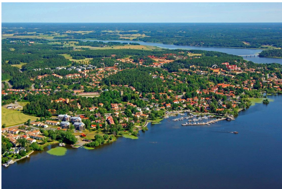
Sigtuna, a város, ahol az első svéd érmét verték

Megvan a hagyomány, könnyű a kapcsolatteremtés, nem félnek. Miért ne lenne így természetes, hogy övék (is) a világ?