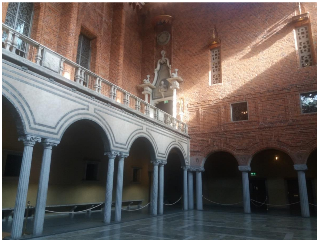
A svéd városháza kék terme, ahol a Nobel díjas előadásokat tartják

Eközben Svédország nem világnemzet. Erős saját kultúrájuk, szisztematikusan és sikeresen képviselik saját érdekeiket a politikában és a gazdaságban. Nem az mozgatja őket, hogy a világhoz igazodjanak, hanem fordítva: saját kultúrájukat tudják világszinten elfogadtatni. A svéd vidéken az IKEA katalógusokban olyan jól mutató színes faházak állnak. A stockholmi városházában minden svéd kézművesek terméke.