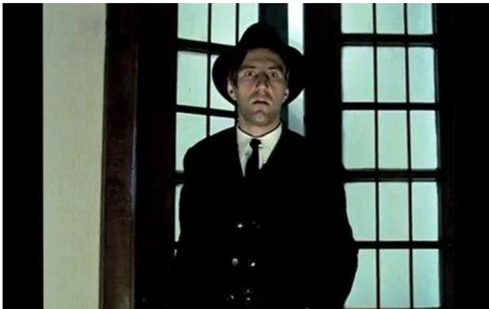
Egy paraszti sorból származó egyetemista A Tanítványok című film főhőse