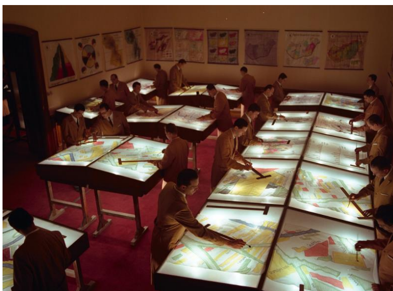
A kiállítás előkészítése Bereményi A Tanítványok című filmjében – Forrás: mandarchivum.hu

„A magyarság birtokpolitikai szempontokból hátrányos helyzetben van. (...) Kemsén, sőt az egész Ormánságban a terület bevonás nem volt lehetséges: kirobbant az egykézés. A forgalmi gazdaságba kilökött parasztságnak választani kellett a szó legteljesebb értelmében: az élet és a halál között. És választottak! A föld hiánya így lesz a nemzetpusztulás előidézője és a nagybirtokok halálgyűrűje a nép megfojtója.” A két háború közötti Magyarország egyik legégetőbb társadalmi bajáról, a földkérdésről aligha lehetett egyértelműbb mondatokat írni. Az egyenlőtlen birtokszerkezetről szóló sorokat mégsem egy illegális kommunista vagy emigrációs oktobrista kiadványból idéztük. Az 1936-ban megjelent Elsüllyedt falu a Dunántúlon – Kemse község élete című kötetet fiatal, országreformot áhító értelmiségiek készítették egy Baranya megyei községben végzett munkájuk nyomán. A már-már lázító sorokat is tartalmazó könyv előszavát Teleki Pál földrajztudós, volt (és leendő) magyar királyi miniszterelnök, maga is birtokos arisztokrata írta.