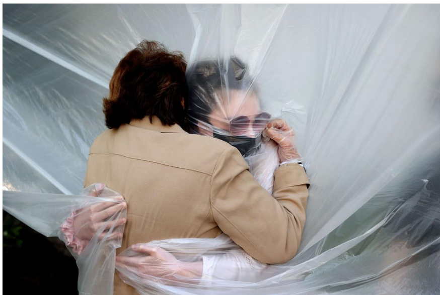
Találkozás a nagymamával

Nem tudjuk, hogy a vírus mennyire mutálódik, mennyire és mennyi ideig hat a szerzett immunitás a fertőzésen átesettek védelmében. Azt sem tudjuk, hogy sikerül-e belátható időn belül biztonságos szérumot és hatásos terápiát kialakítani. A válságintézkedések a járvány terjedését lassítják és megváltoztatják azt, hogy milyen arányban fertőződnek meg a legveszélyeztetettebbek, de önmagukban nem vezetnek egyensúlyi állapothoz. A nyájimmunitás persze előbb-utóbb kialakul, de nem mindegy, hogy milyen áron (a halottak számában számítva) és szinten (kialakítva egy stabil betegarányt és halálozási valószínűséget), mit visel el a társadalom – előzetesen és utólag. A nyájimmunitásnak valós alternatívája akkor van, ha sikerül hatásos szérummal lezorítani a fertőződés veszélyét; ezt az esetleges újrafertőződés tovább nehezítheti. Eközben a terjedést lelassító és fertőződési arányokat megváltoztató beavatkozások gazdasági kára egyre nagyobb és a népesség tűréshatárához egyre közelebb kerül.