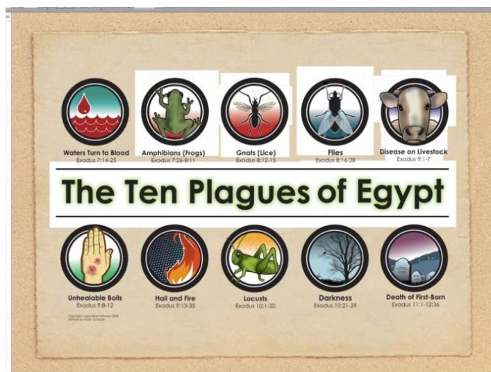
Az egyiptomi tíz csapás

A járványnak azonban önmagán túlmutató összefüggései és tanulságai is vannak. A koronavírus-járvány egy előjelek nélküli globális természeti katasztrófa, pontosabban fogalmazva gyorsabban terjed, mint amennyi idő alatt a társadalom, a gazdaság védekezni tudna ellene. A gyorsabb és lassabb, globális és lokális természeti katasztrófák sorába illeszkedik. A katasztrófákról, azok természetéről és bekövetkezésük valószínűségéről rendelkezünk tapasztalatokkal. A teljesség igénye nélkül: erdőtüzek, izlandi vulkánkitörés, az olaszországi nagy áramkimaradás, vagy akár csak a pandémia területéről: kergemarha-kór, sertéspestis, madárinfluenza; AIDS, SARS, kanyaró és TBC, korábban spanyolnátha). Egy ilyen esemény módosíthatja a társadalom (és a politika) értékítéletét, felértékelheti a biztonságot a növekedés rovására. Fontosabbá válhatnak az ellenálló- és alkalmazkodóképességet, az előrejelzést és a korai riasztást, reagálást szolgáló beavatkozások és a katasztrófák (és kezelésük) kárvallottjainak kompenzációját és erőforrásaik újrahasznosítását célzó eszközök.