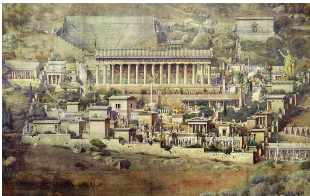
Ilyen lehetett a Delphoi jósda

A járvány gazdasági következményei kapcsán mindenekelőtt az a kérdés foglalkoztatja a (konyha-) közgazdász-társadalmat, hogy a válság az ábécé melyik betűje szerint fog viselkedni, vajon a gazdasági aktivitás szintje V, U vagy W (vagy más? L vagy J? van még elég nagybetű az ábécében) alakot fog leírni. Komolyabban fogalmazva: gyorsabban vagy lassabban térünk-e vissza a válság előtti növekedési pályához, várható-e a pályától való ismételt letérés vagy ilyenek (erősödő vagy csillapodó) sorozata? Egyáltalában, a válság utáni növekedési pálya változatlan marad-e, ugyanabba a gazdasági folyóba lépünk-e be a járvány múltával, mint ami előtte jellemezte a hazai és nemzetközi gazdaságot? Marad-e a gyors növekedés évtizede, esetleg gyorsul-e, avagy inkább ellaposodással, a növekedés leállásával kell-e számolnunk?