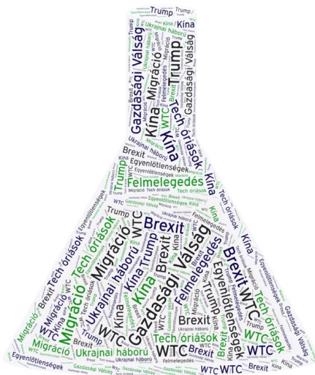
Változáslombik – Összkép grafika

Az elmúlt időszak eseményei alaposan alámoták a világ biztonságába vetett hitünket. A kilencvenes évek arról szóltak, hogy mindenhova elérkezik a Béke, a Biztonság, a Prosperitás. A bajok átmenetiek és megoldódnak - csak attól tartottunk, hogy az évezredváltás informatikai felfordulást okoz, de még ebből sem lett semmi. Aztán 2001 óta egyre egyértelműbb, hogy még nem jött el a happy end.