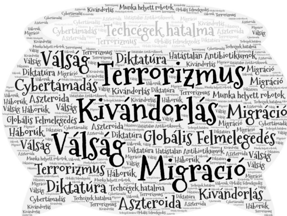
A félelem üstje - Összkép grafika

Az azonban biztos, hogy egyre látványosabb a félnivalók szerepe az életünkben. Jön a válság, jönnek a migránsok. Életünk irányítását vagy a technológiai óriás cégek veszik át, vagy az állam. Összeomlik civilizációink a globális felmelegedésben, megbénít minket egy cybertámadás... Fortyog a félelem üstje.