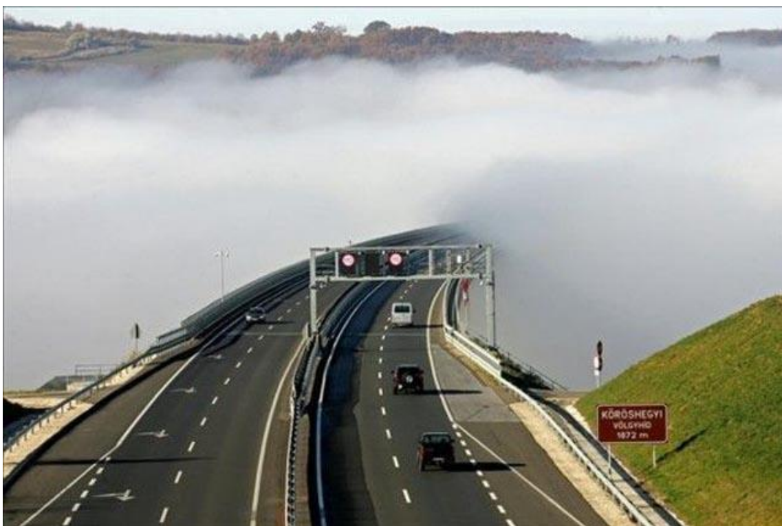
Köd a Köröshegyi völgyhíd felett